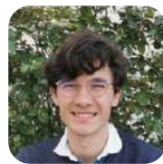
Malo de France Service Civique